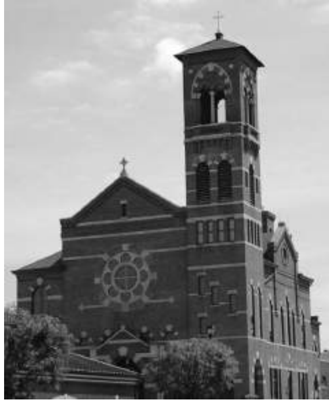
महिला यौन हिंसाका सिकार भएका विवरणहरू तथ्यसहित बाहिर आए । यौन हिंसामा परेका अधिकांश बालबालिकाहरू दश वर्ष भन्दा मुनिका छन् ।

विश्वको न.१ प्रजातान्त्रिक देश र विश्वमा ईसाई धर्म प्रचारको मुख्य ठेकेदार अमेरिकाभित्रै मानिसहरूले कल्पना नगरेका ईसाई पादरीहरूका यौन कुकृतिको सतहमा आए । पछिल्लो पटक खुलस्त भएको घटनाअनुसार अमेरिकाको पेन्सिलभेनियास्थित क्याथोलिक चर्चहरूमा रहेका तीन सयभन्दा बढी धर्म गुरुहरूबाट एकहजार भन्दा बढी बालबालिका तथा