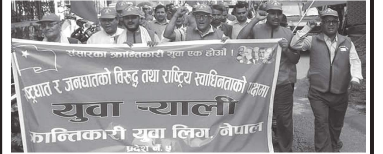
बुटवल । नेकपा (क्रान्तिकारी माओवादी) नं. प्रदेशको आयोजनामा गरिएको युवा मार्चपास को युवा संगठन क्रान्तिकारी युवा लिगको ५ बुटवलमा सन्दार ... बाँकी ७ पेजमा

वर्ष २ अङ्क ४६ पूर्णाङ्क ९५ २०७५ जेठ ७ गते सोमबार Monday, May 21, 2018 पृष्ठ ८ मूल्य रु. १०/-