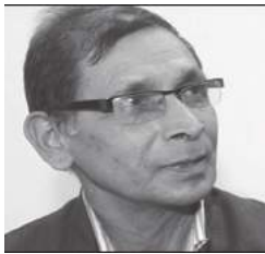
मोहन वैद्य 'किरण'

पार्टीको पछिल्लो विभाजनलाई गम्भीरतापूर्वक लिनु पर्छ । यो पार्टी विभिन्न धाराहरूको बिचमा एकता हुँदै आएको छ । जनयुद्ध इतिहासको महान् कार्य हो । यो सशक्त ढंगले अगाडि बढ्दै जाने क्रममा नेतृत्वले गम्भीर प्रकृतिको विश्वासघात गर्नु । चुनवाडको बैठक फुटको विचारोपण हो । हामीले जनयुद्धमा प्रतिवद्धता जोडेर गरेका थियौं, जबसम्म नेपालमा शोषित उत्पीडित जनसमुदायको राज्यसत्ता आउँदैन, तबसम्म हाम्रो अभियान जारी रहन्छ भन्ने थियो । चुनवाडले लोकतान्त्रिक गणतन्त्र ल्यायो । लोकतान्त्रिक गणतन्त्रका लागि रणनीतिक प्रत्याक्रमणको फौजी कार्यक्रम विकास गरियो । काँग्रेसहरूलाई अप्ठेरो परेको बेला संयुक्त मोर्चा गर्न हुँदैन थियो भन्ने त होइन । संविधानसभा पनि गर्नु पर्छ । संयुक्त मोर्चाका नाममा नयाँ जनवाद छोडियो । जनयुद्धको प्रतिवद्धतालाई अन्तिममा २०६३ मङ्सिर ५ मा जुन विस्तृत शान्ति सम्झौतामा जनयुद्ध अन्त्य भएको घोषणा गरियो । केन्द्रीय समितिको बैठकबिना नै बाबुराम र प्रचण्डले एकल निर्णय गरे । दम्भले भरिएका बाबुराम र प्रचण्डले कानुनी तरिकाले सेना समायोजनदेखि अनेकौं कुरामा गल्ती गरे । सरसल्लाह नै