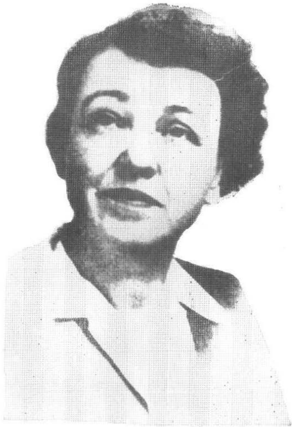
作 言 像