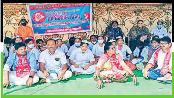
సమ్మె చేస్తున్న స్టాఫ్ నర్సులు

అదిలాబాద్ లో జనవరి 28న రిమ్స్ లో పనిచేస్తున్న 300 వోసీఎస్ స్టాఫ్ నర్సులు 8 నెలల వేతనాలు ఇవ్వాలని రిమ్స్ ముందు నిరసనక సమ్మెను నిర్వహించారు. 8 నెలల నుంచి వేతనాలు రాకపోవడంతో వారి జీవనం కొనసాగించాలంటే కష్టంగా మారుతుందన్నారు. జిల్లా కలెక్టర్ ను కలిసి వివరించినప్పటికీ వారి సమస్యలు పరిష్కారం కాలేదన్నారు. వేతనాలు రాకపోవడంతో కుటుంబ పోషణ కష్టంగా మారినదన్నారు. వెంటనే ఆరోగ్య శాఖ మంత్రి హరీష్ రావు స్పందించి