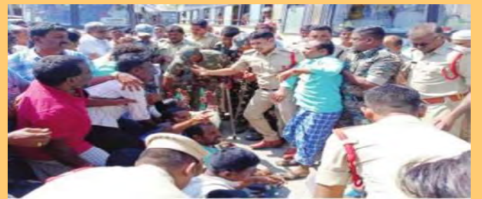
ఆందోళన చేస్తున్న రైతులను అరెస్టు చేస్తున్న పోలీసులు