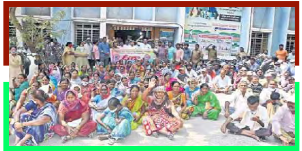
ఓడి కార్యాలయం ఎదుట ధర్నా చేస్తున్న కార్మికులు

కరీంనగర్: నగరపాలక సంస్థలో పని చేస్తున్న కార్మికులు, కాంట్రాక్టు కార్మికుల సమస్యలను వెంటనే పరిష్కరించాలని డిమాండ్ చేస్తూ నగరపాలక సంస్థ కార్యాలయం ఎదుట ధర్నా నిర్వహిస్తూ మున్సిపల్ కార్మికులకు ఇవ్వాలని ఐదు నెలల పీఆర్ సి బకాయిలను