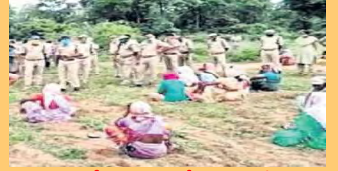
పాడు కోసం పాఠాటం చేస్తున్న అనివాసీలు