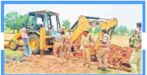
పోడు భూముల్లో ట్రెయిన్ తీయిస్తున్న అటవీశాఖ అధికారులు

ఆదిలాబాద్: ఫిబ్రవరి 13న అటవీ హక్కులను కాలరాసే అటవీ నియమాలను రద్దు చేసి, ఆదివాసులు సాగుచేసుకుంటున్న భూములకు ఆంక్షలు లేకుండా పట్టాలు ఇవ్వాలనే డిమాండ్తో ఆదివాసులు నిర్మల్ టౌన్ కలెక్టర్ కార్యాలయం ముందు ధర్నా చేపట్టారు. ఆదివాసుల భూములకు పట్టాలిస్తున్నామనే పేరుతో ప్రభుత్వం కుట్రలకు