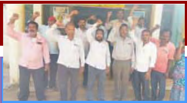
కాంట్రాక్ట్ కార్మికుల నిరసన

ఆదిలాబాద్: సమగ్ర శిక్షలో పనిచేస్తున్న కేజీబీవీ, యుఆర్ఎస్ బోధన, బోధనేతర సిబ్బంది, క్లస్టర్ రిసోర్స్ పర్సన్లు, విలీనవిద్య రిసోర్స్ పర్సన్లు, ఎంఐఎస్ కోఆర్డినేటర్లు, సీసీవోలు, మెసెంజర్లు డీపీ ఎంఐఎస్ కోఆర్డినేటర్లు, సీసీవోలు, మెసెంజర్లు, డీపీవో సిబ్బంది వారు పనిచేస్తున్న కేంద్రాల వద్ద తమను రెగ్యులర్ చేయాలంటూ ప్లకార్డులు ప్రదర్శించారు. సమగ్ర శిక్షలో 15 ఏళ్లుగా ఒప్పంద ఉద్యోగులుగా పనిచేస్తున్నామని, తమ సర్వీస్ను క్రమబద్ధీకరణ చేయాలని డిమాండ్ చేశారు. అప్పటి వరకు తక్షణమే బేసికేపే అమలు చేయాలన్నారు. ప్రతి ఉద్యోగికి ఆరోగ్యభీమా 10 లక్షలు, ప్రమాద బీమా 5 లక్షల సౌకర్యం కల్పించాలన్నారు. టర్నినేషన్ విధానం ఎత్తివేయాలని డిమాండ్ చేశారు.