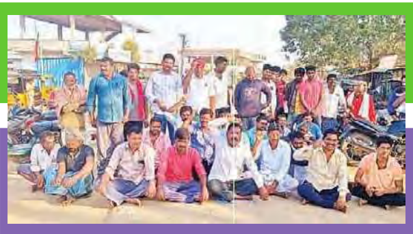
పెంబి ప్రధాన రహదారిపై ఆందోళన చేస్తున్న రైతులు

పెంబి: వ్యవసాయ రంగానికి నిరంతరం కోతలు లేకుండా విద్యుత్ ఇవ్వాలని రైతులు పెంబి ప్రధాన రహదారిపై ఆందోళన చేశారు. ఈ