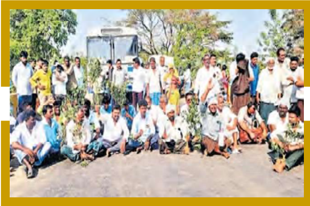
పురుగు మందు డబ్బాలతో రాష్ట్రారోకో చేస్తున్న రైతులు

మా భూములు మాకు ఇవ్వక పోవడం ఎంత వరకు న్యాయమని ఆగ్రహం వ్యక్తం చేశారు. మా భూముల కొరకు అధికారుల చుట్టూ మేము తిరుగుతూ వుంటే ప్రభుత్వం 18.27 ఎకరాల పట్టా భూమిని స్వాధీనం చేసుకుంది. దీనితో పాటు ఐదు ఎకరాలు అసైన్డ్ భూమిని కూడా స్వాధీనం చేసుకుంది. సొరంగం పనుల కోసం మా పట్టా భూములను లీజుకు తీసుకొని పనులు పూర్తి అయిన తర్వాత కూడా మా భూమి మాకు తిరిగి ఇవ్వకుండా ప్రభుత్వం స్వాధీనం చేసుకోవడం అన్యాయమని ఆవేదన వ్యక్తం చేస్తూ మా భూమిని తిరిగి మాకు