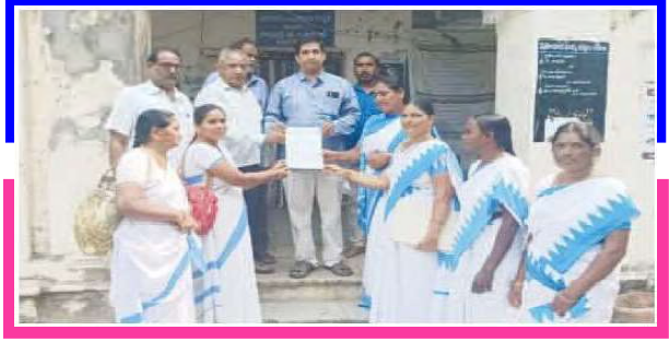
వినతిపత్రం అందజేస్తున్న ఆశా వర్కర్లు

అంగన్వాడీ, ఆశ, మధ్యాహ్నం భోజనం, ఫీల్డ్ అసిస్టెంట్లు తదితర రంగాలను ప్రైవేటుపరం చేసేందుకు కేంద్ర ప్రభుత్వం ప్రయత్నిస్తుందని కార్మికులు ఆగ్రహం వ్యక్తం చేశారు. రాష్ట్రంలో స్కీం వర్కర్లు 3.50 లక్షల మంది 40 సం॥రాలుగా తమ సేవలు అందిస్తున్నారు.