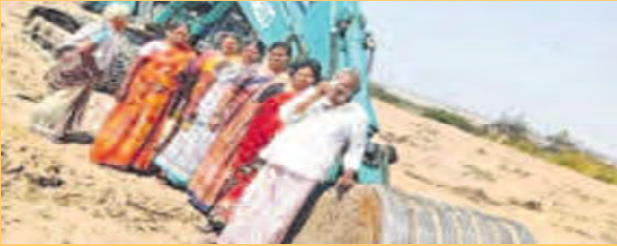
సీతమ్మ సాగర్ వద్ద పనులను అడ్డుకున్న నిర్వాసిక రైతులు