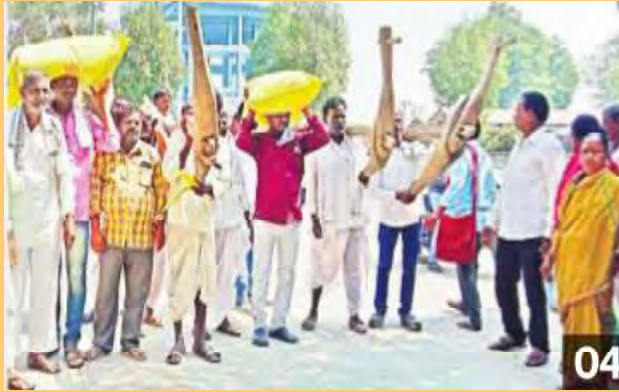
యూలయూ బస్టాల్తో అన్నదాతల ఆందోళన