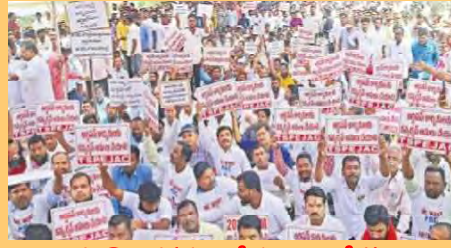
విద్యుత్ సౌకర్య ఉద్యోగుల ఆందోళన