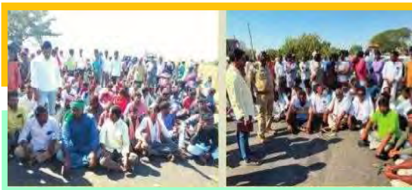
కన్నెపల్లి విద్యుత్ ఉపకేంద్రం ప్రధాన రహదారిపై ధర్నా చేస్తున్న రైతులు

భీమిలి: కన్నెపల్లి మండల కేంద్రంలోని విద్యుత్ ఉపకేంద్రం ప్రధాన రహదారిపై రైతులు ధర్నా నిర్వహించారు. ప్రభుత్వానికి వ్యతిరేకంగా ధర్నాలో రెండు గంటల పాటు 50 మంది రైతులు నినాదాలు చేశారు. ఈ సందర్భంగా రైతులు మాట్లాడుతూ ప్రభుత్వం 24 గంటలు