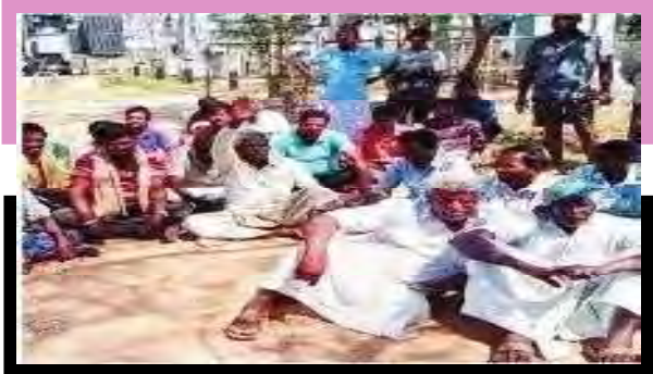
ఐతోల్ విద్యుత్ సబ్ స్టేషన్ ఎదుట ధర్నా చేస్తున్న రైతులు

అయిజ: రైతులు అయిజ మండల కేంద్రంలో సబ్ స్టేషన్ ఎదుట ధర్నా చేపట్టారు. వ్యవసాయానికి 24 గం|| ఉచిత కరెంట్ అందిస్తామని హామీ ఇచ్చిన రాష్ట్ర ప్రభుత్వం కనీసం 12 గం|| కూడా కరెంట్ ను అందించలేక పోతుండన్నారు. రాష్ట్రంలో ఉన్న రైతులకే కరెంట్ అందించలేని కేసీఆర్ దేశం మొత్తం ఉచిత కరెంట్ ఇస్తానని చెప్పడం