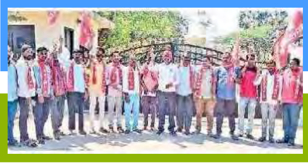
నిరసన తెలుపుతున్న కార్మికులు

పనిచేస్తున్న వారికి రక్షణ పరికరాలు ఇవ్వాలి, వైద్య సౌకర్యానికి ఆసుపత్రి బుక్కులు, పీఎఫ్, ఈఎస్ఐ సౌకర్యం కల్పించాలన్నారు. ప్రమాదంలో మరణిస్తే 50 లక్షల నష్ట పరిహారం చెల్లించాలని సింగరేణి యాజమాన్యాన్ని డిమాండ్ చేశారు.