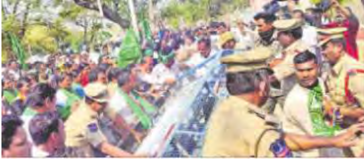
ఐటీడీఏ ప్రధాన కార్యాలయంలోకి పొచ్చుకెళ్తున్న ఆదివాసీలు

త రతరాల నుండి మూల వానులైన ఆదివాసీలు భూమి-భుక్తి-విముక్తి కోసం జల్-జంగల్-జమీన్, ఇజ్జత్ అధికారం కోసం విరోధితంగా పోరాడుతూనే వున్నారు. పోరాటాలు ఆదివాసీలకు కొత్తేమి కాదు. బ్రిటీష్ సైన్యాలతో విరోధితంగా పోరాడి ఉరికొయ్యలను ముద్దాడిన రాంజీ గోండు రణం బాట, నైజాం సర్కార్ పైజామా తడిపించి గోండు జాతికి బాండే బాట చూపిన కొమురంభీం స్ఫూర్తితో, ఇంద్రవెళ్లి అమరల వారనత్వాన్ని నేటికీ కొనసాగిస్తునే ఉన్నారు.