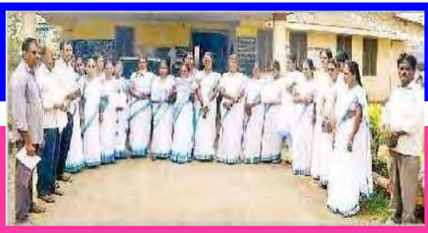
ఆశ కార్యకర్తల నిరసన

ఖమ్మం: ఆశ కార్యకర్తలు, స్కీమ్ వర్కర్ల సమస్యలను పరిష్కరించాలని కోరుతూ జనవరి 7న స్థానిక తహశీల్దార్ కార్యాలయం