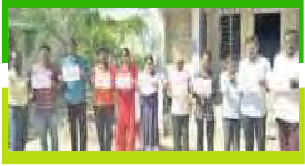
ఫైకార్డులతో నిరసన తెలుపుతున్న ఉద్యోగులు

ఖమ్మం: ఖమ్మం జిల్లా వైరా నియోజకవర్గ కేంద్రంలో పనిచేస్తున్న జర్నలిస్టులకు ఇళ్ల స్థలాలు కేటాయించాలని డిమాండ్ చేస్తూ వైరాలోని ప్రింట్ అండ్ ఎలక్ట్రానిక్ మీడియా జర్నలిస్టులు రిలే నిరాహార దీక్షలు చేపట్టారు. వైరాలోని ప్రభుత్వ జూనియర్ కళాశాల ఎదురుగా రిలే నిరాహార దీక్ష శిబిరాన్ని ఏర్పాటు చేశారు. ముందుగా వైరాలో ర్యాలీ నిర్వహించారు. అనంతరం రిలే నిరాహార దీక్ష శిబిరాన్ని నడిపారు. ఇందులో చాలామంది జర్నలిస్టులు పాల్గొన్నారు.