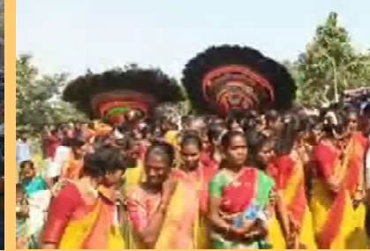
గున్నాడి ఆడుతున్న ఆదివాసీలు