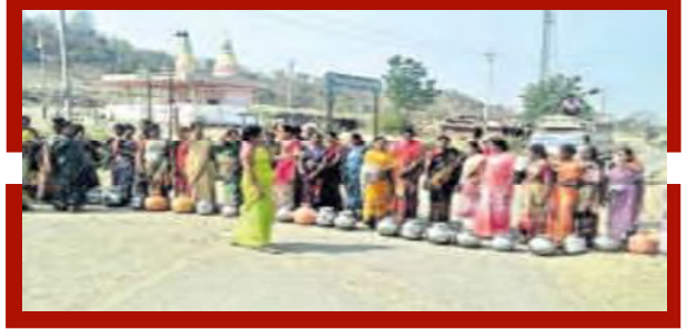
రోడ్డుపై ఖాళీ ఇంటెంట్ మహిళల రాస్తారోకో

సరఫరా చేయాలని డిమాండ్ చేస్తూ రోడ్డుపై బయోయించారు. అధికార్లకు ఎన్నిసార్లు చెప్పిన పట్టించుకోవడం లేదని 3 ఫేజ్ కరెంటు లేక వాటర్ ట్యాంక్ లోకి నీరు రావడం లేదని కనీస అవసరాలకు అవస్థలు పడుతున్నామని ఆవేదన వ్యక్తం చేస్తూ రాస్తారోకో చేయడంతో రోడ్డుకి రువైపులా వాహనాలు నిలిచిపోయాయి. వెంటనే అధికారులు