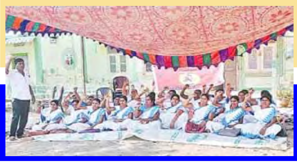
పన్నురులో ఆశా కార్యకర్తల ధర్నా

హామీలను అమలు చేయాలని కోరుతూ తమ సమస్యల పరిష్కారం కోసం, తమ న్యాయమైన డిమాండ్లను వెంటనే పరిష్కరించాలని ప్రభుత్వాన్ని డిమాండ్ చేశారు.