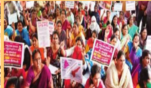
ఆందోళన చేస్తున్న 2008 డీఎస్సీ క్యాబిన్లపై