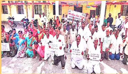
వెంకాళ్ళపై నిలబడి నిరసన తెలుపుతున్న బాధిత రైతులు