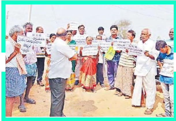
అధికారులను అడ్డుకొని నిరసన తెలుపుతున్న రైతులు

రిజినల్ రింగు రోడ్డుకు మా భూములు ఇచ్చే ప్రసక్తే లేదని ఇప్పటికే యాదగిరిగుట్ట జాతీయ రహదారి విస్తరణకు పునాది అయింది. కాళేశ్వరం, రిలయన్స్ పైప్ లైన్, హైటెన్షన్ విద్యుత్ స్థంబాల ఏర్పాటుకు తమ భూములను ఇచ్చి నష్టపోయామని రైతులు ఆవేదన వ్యక్తం చేశారు. అధికారులు బలవంతంగా ఆర్ఆర్ఆర్ నిర్మాణానికి మాభూముల్లో సర్వే చేపట్టి భయభ్రాంతులకు గురి చేస్తున్నారని ఆగ్రహం వ్యక్తం చేస్తూ మండలంలోని రాయిగిరి, ఎర్రంబెల్లి, తుక్కాపూర్, గాస్ నగర్, కేసారం, బాలంపల్లి, పెంచికల్ పహాడ్ గ్రామాల రైతులు సబ్ కరిక్టర్ కార్యాలయంలో మోకాళ్ళపై నిలబడి నిరసన చేపట్టారు. ఇప్పటికే పలు