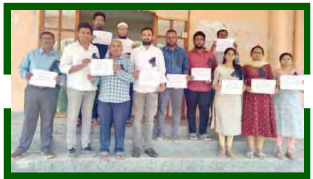
112 జీవో రద్దు చేయాలని నిరసన తెలుపుతున్న ఇంజనీర్లు

సర్వీసు రూల్స్ కు విరుద్ధంగా ఏఈఈల ప్రయోజనాలు దెబ్బతీసే