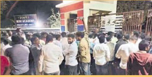
పాఠశాల ముందు ఆందోళనకు బిగిన తల్లిదండ్రులు