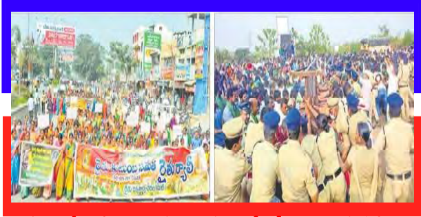
కామారెడ్డిలో ర్యాలీ నిర్వహిస్తున్న రైతులను బారికేడ్లతో అడ్డుకుంటున్న పోలీసులు

జగిత్యాల-కామారెడ్డి: జగిత్యాల, కామారెడ్డి రైతులు తమ పంట భూములను పారిశ్రామిక జోన్, హరితజోన్లుగా మున్సిపల్ అధికారులు ప్రకటించిన మాస్టర్ ప్లాన్ పై రైతులు ఆందోళనకు దిగారు. తమను సంప్రదించకుండా తమ భూములను గుంజుకుంటే ఊరుకునేది లేదని హెచ్చరించారు. అధికార నాయకులు రియల్ ఎస్టేట్ వ్యాపారుల