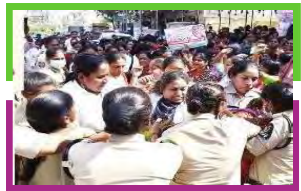
అసెంబ్లీ ముట్టడించిన ఏఎన్ఎంలు

ఫిబ్రవరి 9న రాష్ట్రంలో పని చేస్తున్న 35 వేల మంది రెండవ ఏఎన్ఎమ్లను జీవో నెంబర్ 16లో చేర్చి రెగ్యులర్ చేయాలని కోరుతూ ఏఎన్ఎమ్లు నిర్వహించిన ధర్నా, చలో అసెంబ్లీ, వివిధ జిల్లాల నుండి వచ్చిన ఏఎన్ఎమ్లు నారాయణగూడ వద్ద ధర్నా నిర్వహించి అసెంబ్లీని ముట్టడించారు. వారు మాట్లాడుతూ ఆరోగ్య రంగంలో తెలంగాణ జాతీయ స్థాయిలో 3వ స్థానం సాధించడానికి రెండవ ఏఎన్ఎంలే ప్రధాన కారణం అన్నారు. కోవిడ్ టైంలో ఎంతో సేవ చేశామని, ఆ క్రమంలోనే చాలా మంది మరణించినప్పటికీ ప్రభుత్వం నుండి కుటుంబాలకు ఎంటువంటి సహాయం అందలేదని ఆవేదన వ్యక్తం చేశారు. వెంటనే కాంట్రాక్ట్, ఔట్ సోర్సింగ్ ఏఎన్ఎమ్ల సర్వీసులను