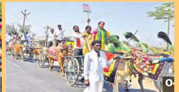
ఎడ్ల బండ్లపై నిర్వాసితుల నిరసన