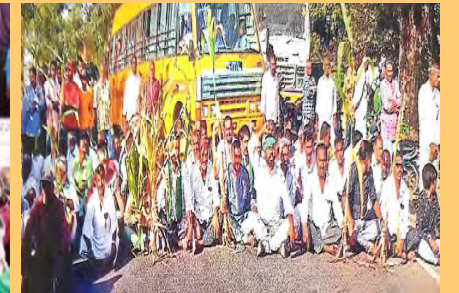
రోడ్డుపై టైతాయింబిన రైతులు