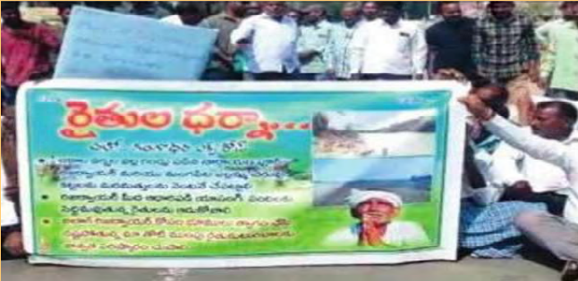
రాస్తారోకో చేస్తున్న రైతులు