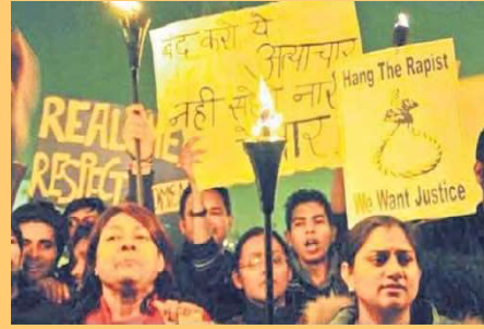
గ్యాంగు అత్యాచారాలకు వ్యతిరేకంగా పోరాడుతున్నారు