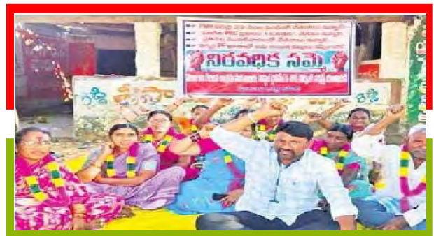
బీజ్జా శిబిరంలో ఆశ్రమ పాఠశాలల ఉద్యోగులు

ఏటూరునాగారంలో తమ సమస్యలను పరిష్కరించాలని గిరిజన ఆశ్రమ పాఠశాలల ఔట్ సోర్సింగ్ కార్మికులు సమ్మెకు దిగారు. ఈ సందర్భంగా మండల కేంద్రంలోని పాత తహసీల్దార్ కార్యాలయం ఎదుట నిరవధిక దీక్ష చేపట్టారు. జిల్లాలోని గిరిజన సంక్షేమ శాఖ పరిధిలోని కళాశాలల హస్తల్స్ లో పనిచేస్తున్న ఔట్ సోర్సింగ్ ఉద్యోగులకు 22 నెలలుగా వేతనాలు పెండింగ్ లో ఉన్నాయని ఉద్యోగులు తెలిపారు. దీంతో వారి కుటుంబాలు వీధిన పడే పరిస్థితులు నెలకొన్నాయన్నారు. పెండింగ్ వేతనాలు చెల్లించాలని అనేక సార్లు ఎన్నో దఫాలుగా అధికారులకు వినతులు సమర్పించినా, దశల వారీ