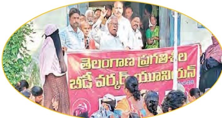
జీవన ధృతి కల్పించాలని బీడీ కార్మికుల డిమాండ్

గతంలో రాజకీయ నాయకులు ఇచ్చిన హామీలు అమలు కాకపోవడంతో బీడీ కార్మికుల పరిస్థితి మొదటికి వచ్చింది. ఎన్నికల్లో