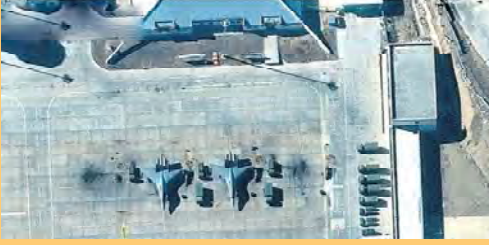
టిడెట్లోని కాంగ్రెస్ బాంగ్లా ఎయిర్ బేస్లో సుభోయ్-80 ఫటర్ జెట్లను హెహాలంబిన చెనా