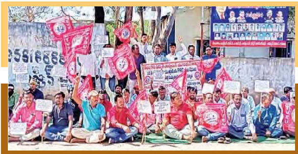
ధర్నా చేస్తున్న విద్యుత్ కార్మికులు

ఆర్కూర్ టౌన్: తెలంగాణ విద్యుత్ కార్మికులు ఆర్కూర్ పట్టణంలోని జిరాయత్ నగర్ డిఈ కార్యాలయం ముందు ధర్నా నిర్వహించారు.