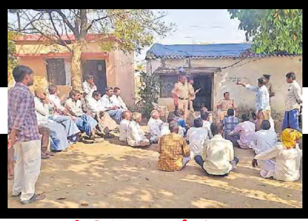
సబ్సిడీస్ ఎదుట ధర్నా చేస్తున్న రైతులు

విద్యుత్ కోతలతో పంటలు దెబ్బ తింటున్నాయని మండల కేంద్రంలోని రెబ్బన, ముత్తాపూర్, కన్నపల్లి, మూడవెల్లి గ్రామాల రైతులు సబ్సిడీస్ ఎదుట ప్రధాన రహదారిపై రాస్తారోకో చేపట్టి ప్రభుత్వానికి వ్యతిరేకంగా నినాదాలు చేస్తూ ప్రభుత్వం 24 గంటలు ఉచిత విద్యుత్ ఇస్తామని చెబుతుండే తప్ప పగలు 3 ఫేజ్ ఇవ్వకుండా రాత్రి సమయంలో ఇస్తున్నారని దీనిపై రాత్రిపూట పంట పొలాలకు వెళ్ళలేక ఇబ్బందులు పడుతున్నారని రైతులు ఆవేదన వ్యక్తం చేస్తూ ప్రభుత్వం తమ సమస్యలను పట్టించుకోవడం లేదని వెంటనే సమస్యలు పరిష్కరించకపోతే ఆందోళనలు తీవ్రతరం చేస్తామని హెచ్చరించారు.