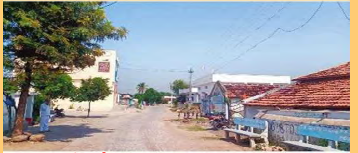
అభివృద్ధి పేరుతో ధూమిని పోగొట్టుకున్న కొండన్న పల్లి గ్రామం