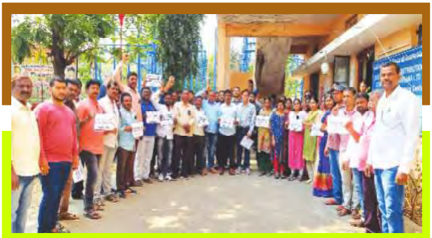
ఆర్డిజన్ కార్యక్రమ ధర్నా

1999-2004లో సంవత్సరాల మధ్య కాలంలో నియమితులైన విద్యుత్ ఉద్యోగులందరికి అదే విధంగా ఆర్డిజన్ కార్మికులకు కన్వర్షల్