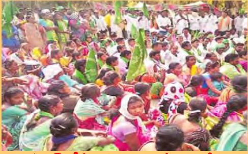
ఉట్యూర్ రోడ్డుపై టైతాయింబిన ఆదివాసీలు