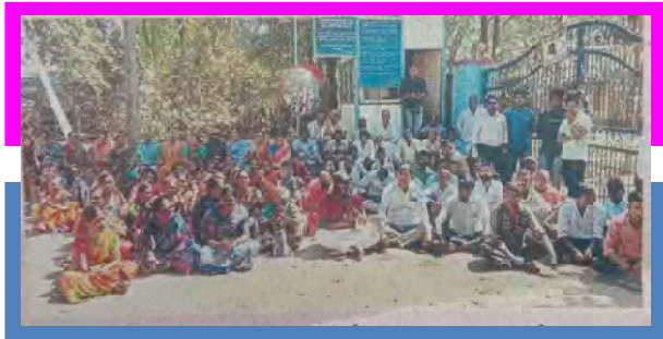
జీఎం కార్యాలయం ఎదుట ధర్నా సోమగూడెం(కె) ప్రజలు

కానీ పేట మండలం సోమగూడెం(కె) గ్రామ ప్రజలు మందమర్రిలోని జీఎం కార్యాలయం ఎదుట ధర్నా నిర్వహించి సింగరేణి