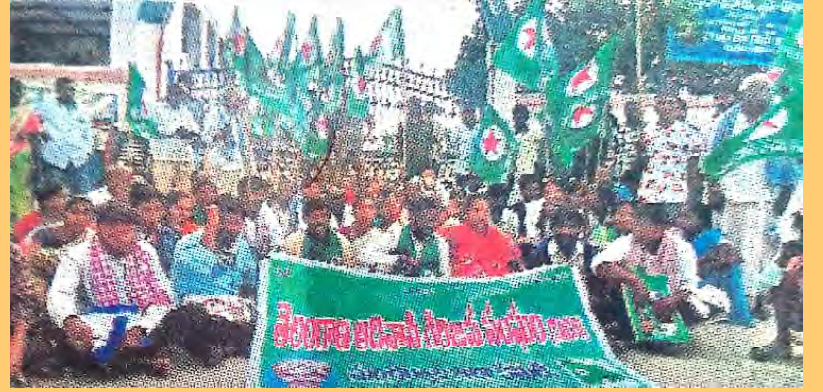
కలిక్లరేట్ ఎదుట ధర్మా చేస్తున్న ఆదివాసీలు