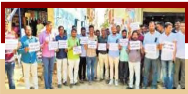
ఫ్లేటార్లుతో జర్నలిస్టుల నిరసన

ఖమ్మం: ఖమ్మం జిల్లా వైరా నియోజకవర్గ కేంద్రంలో పనిచేస్తున్న జర్నలిస్టులకు ఇళ్ల స్థలాలు కేటాయించాలని డిమాండ్ చేస్తూ వైరాలోని ఫ్రింట్ అండ్ ఎలక్ట్రానిక్ మీడియా జర్నలిస్టులు రిలే నిరహార దీక్షలు