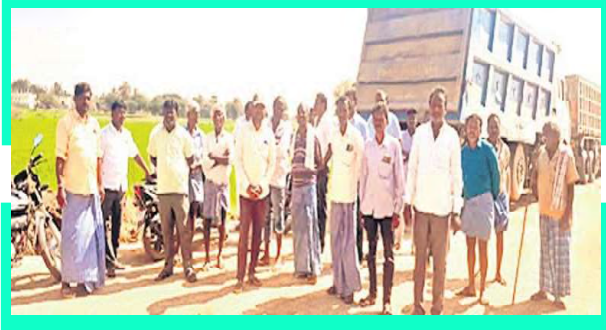
ఇసుక క్వారీలను అడ్డుకున్న గ్రామస్థులు

కరీంనగర్: కరీంనగర్ మండలం చేగుర్తిలోని ఇసుక క్వారీని రద్దు చేయాలని లారీలను అడ్డుకుని చేగుర్తి గ్రామస్థులు ఆందోళనకు దిగారు. కాంట్రాక్టర్ ఏడాదిగా మానేరు వాగు ఇసుకను ఇక్కడ నిల్వ చేస్తున్నాడని వేబిల్లు పొందిన లారీలతో పాటు ఇతర లారీల్లో కూడా ఇసుక