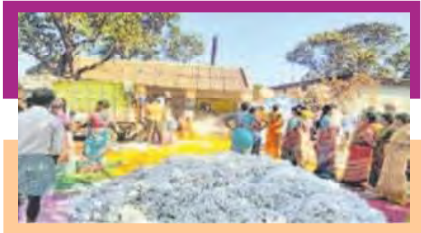
పత్తి మోసానికి పాల్పడిన దళారులను నిరభీష్టున్న రైతులు

హైదరాబాద్: పంటలు పండించడం కోసం రైతులు అహర్నిశలు కష్టపడి వానలు, చీడపీడల బెడద నుండి కాపాడి పండించిన పంటలకు గిట్టుబాటు ధరలు లభించక దళారుల చేతుల్లో మోసపోతున్నారు. మార్కెట్ దళారుల కబంధ హస్తాలలో రాజ్యమేలుతుంటే ప్రభుత్వం నిమ్మకు నీరెత్తినట్టుగా వ్యవహరిస్తున్నది. దీనితో దళారులు రైతుల పంటలకు గిట్టుబాటు ధర ఇవ్వకుండా మోసం చేస్తున్నారు. రైతుల సమస్యలను రాష్ట్ర ప్రభుత్వమే పట్టించుకోకుంటే ఎవరికి చెప్పుకోవాలని రైతులు రాష్ట్ర ప్రభుత్వాన్ని నిలదీస్తూ పత్తికి మద్దతు ధర కల్పించాలని, పెట్టిన పెట్టుబడులను పరిగణనలోకి తీసుకొని క్వింటాలుకు రూ. 15 వేలు ఇవ్వాలని దళారులపై చర్యలు తీసుకోవాలని డిమాండ్ చేశారు. ప్రభుత్వం పట్టించుకోక పోవడంతో దళారులు చేస్తున్న మోసంతో రైతులు అప్పులపాలై ఆత్మహత్యలు చేసుకుంటున్నారని ఆవేళం వ్యక్తం చేశారు. సరైన వ్యవసాయ విధానం, పంటల ప్రణాళిక లేకపోవడం, దిశానిర్దేశ వ్యవస్థలు కుంటుపడడం, వ్యవసాయ ఋణ ప్రణాళికలు