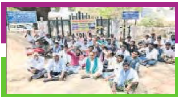
నాగునీటి కోసం రైతుల ఆందోళన

జడ్పర్ల: విద్యుత్ కోతను నిరసిస్తూ జడ్పర్ల మండలంలోని గంగాపూర్ గ్రామ రైతులు 167వ జాతీయ రహదారిపై రాస్టారోకో చేపట్టారు. వ్యవసాయానికి 24 గంటలు ఉచిత విద్యుత్ సరఫరా అందిస్తామన్న తెలంగాణ రాష్ట్ర ప్రభుత్వం గంటకో సారి కరెంట్ కోత విధిస్తుందని రైతన్నలు ఆగ్రహించారు. రైతులు మాట్లాడుతూ యాసంగిలో వరి, మొక్కజొన్న, కూరగాయల పంటలు సాగు చేశామని, పంటలు చేతికొచ్చే సమయంలో విద్యుత్ కోతతో పంటకు సరిపడ నీళ్లు అందడం లేదని అన్నారు. దాని కారణంగా పంటలు ఎండిపోతున్నాయని తమ ఆవేదన వ్యక్తం చేశారు. పశువులకు నీళ్లు తాగడానికి కూడా దొరకడంలేదు. కోతలపై విద్యుత్ అధికారులకు పలుమార్లు ఫిర్యాదులు చేసినా పట్టించుకోవడం లేదు. ఈ కోతలు ఇలాగే కొనసాగితే పంటలు ఎండిపోయి అప్పులు పాలవుతామని