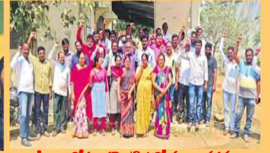
పీఆర్డీ కోసం కరెంట్ ఉద్యోగుల నిరసన