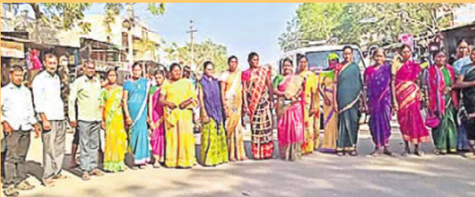
ప్రచారం చేస్తున్న అనివాసీలు