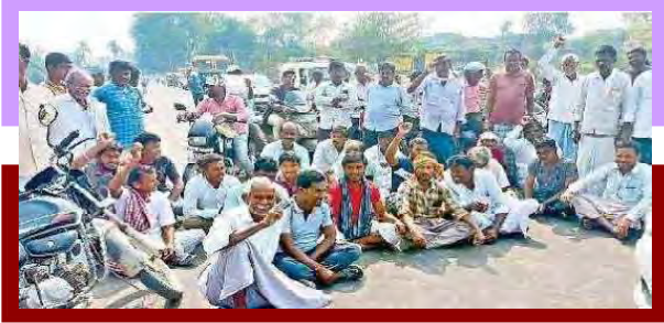
రాస్టారోకో చేస్తున్న తలమడుగు, తాంసి మండలాల రైతులు

2023 జనవరి 31న అనధికారికంగా విద్యుత్తు కోతలు అమలు చేయడానికి వ్యతిరేకంగా తలమడుగు, తాంసి మండలాల రైతులు ఆందోళన చేపట్టారు. వడ్డాడి, హన్నాపూర్ రైతులు మూడు గంటలపాటు ఖోడద్ అంతరాష్ట్ర రహదారిపై రాస్టారోకో నిర్వహించారు. మూడు మండలాలతో పాటు మహారాష్ట్ర వెళ్లే వాహనాల రాకపోకలకు తీవ్ర