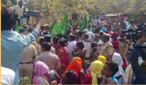
బరీదీపను ముట్టడిస్తున్న ఆదివాసీలు