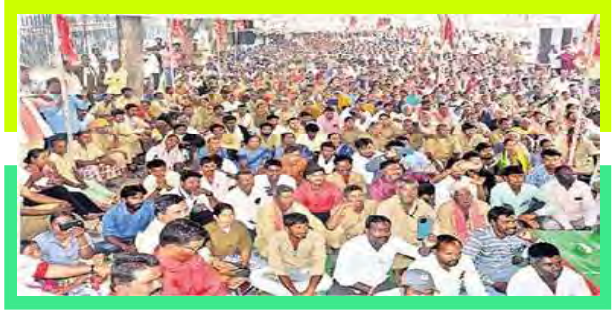
పంచాయతి కార్యక్రమ ఆందోళన

గ్రామ పంచాయతి కార్యక్రమ అసిఫాబాద్ చెకెపోస్టు నుండి కలెక్టరేట్ వరకు ఊరేగింపుగా వెళ్ళి కలెక్టరేట్ ఎదుట ధర్నా నిర్వహించి జీవో 60 ప్రకారం పారిశుద్ధ్య కార్యక్రమాలకు రూ.15,600, కారోబార్ బిల్ కలెక్టర్లకు రూ. 19,500, కంప్యూటర్ ఆపరేటర్లకు రూ.22,750 వేతనాలు చెల్లించాలని, మల్టీ పర్పస్ వర్కర్స్ విధానాన్ని వెంటనే రద్దు