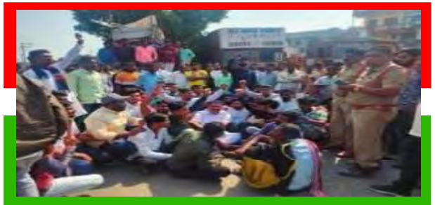
ఆసిఫాబాద్ లో రాస్తారోకో చేస్తున్న క్రీడాకారులు, యువకులు

కుమురంభీం ఆసిఫాబాద్ జిల్లా కేంద్రంలో క్రీడా మైదానం ఏర్పాటు చేయాలని యువకులు, క్రీడాకారులు ప్రధాన రహదారిపై రాస్తారోకో చేశారు. అంబేద్కర్ చౌరస్తాలో రహదారిపై క్రికెట్, వాలీబాల్ ఆడి నిరసన వ్యక్తం చేశారు. దీంతో రహదారి ఇరువైపుల వాహనాలు నిలిచి ట్రాఫిక్ స్తంభించింది. పలువురు క్రీడాకారులు మాట్లాడుతూ ఆసిఫాబాద్ జిల్లాగా ఏర్పడడంతో క్రీడా మైదానాన్ని ప్రభుత్వం జిల్లా పోలీస్ హెడ్ క్వార్టర్ కు కేటాయించిందన్నారు. అనాటి నుంచి జిల్లా కేంద్రంలో