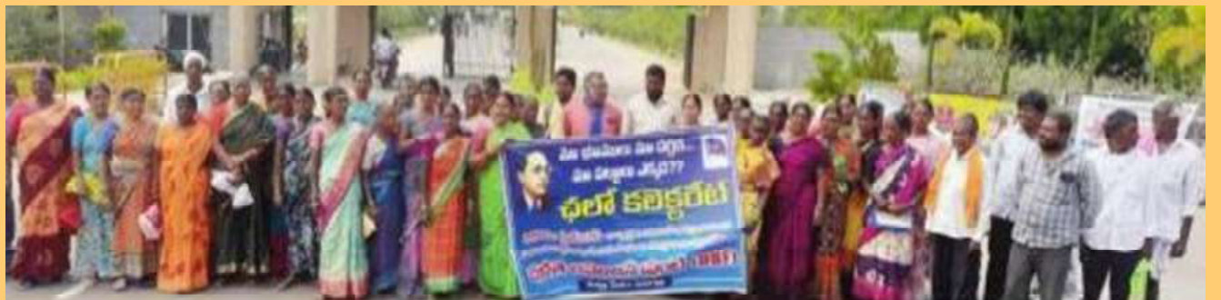
కలెక్టరేట్ ఎదుట నిరసన చేస్తున్న బాధిత రైతులు