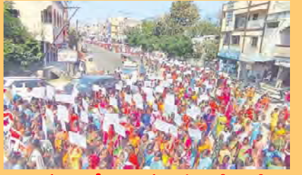
కావారిడ్డిలో దాస్త్రా మహిళల భారీ ర్యాలీ