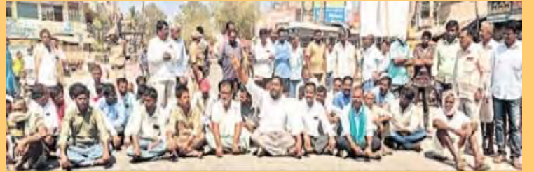
ఎల్లంపల్లి నీటిని విడుదల చేయాలని జాతీయ రహదారిపై ధర్నా చేస్తున్న రైతులు