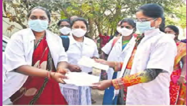
వినతి పత్రాన్ని అందిస్తున్న ఏఎన్ఎంలు