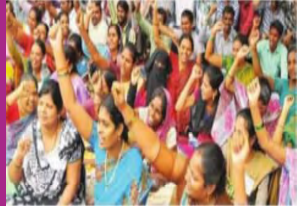
సచివాలయాన్ని ముట్టడించిన ఉపాధ్యాయులు