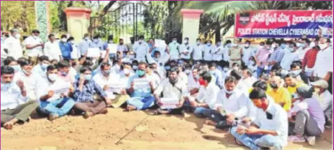
పీఎస్ ముందు ధర్నాకు దిగిన జర్నలిస్టులు