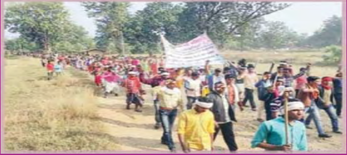
సంఘటితం అవుతున్న బస్తర్ ఆదివాసీలు