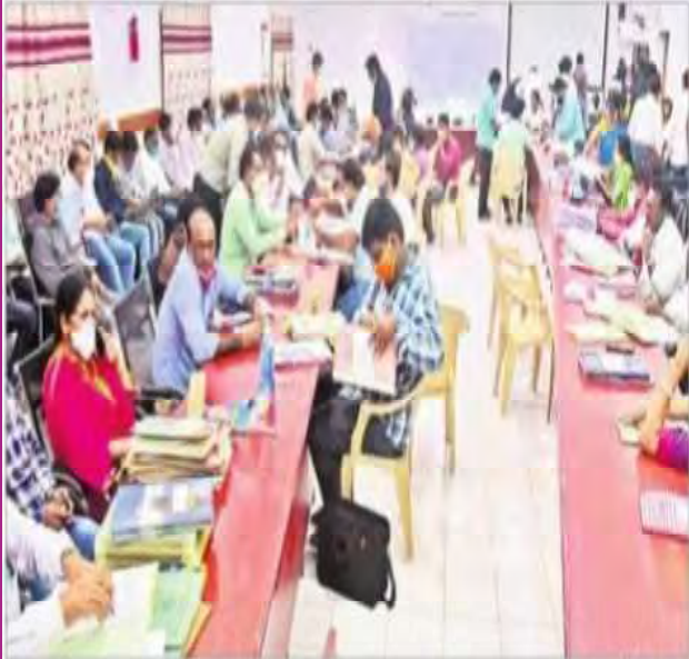
అదిలాబాద్ కలెక్టరేట్ లో ఉద్యోగుల విభజనను పరిశీలిస్తున్న అధికారులు