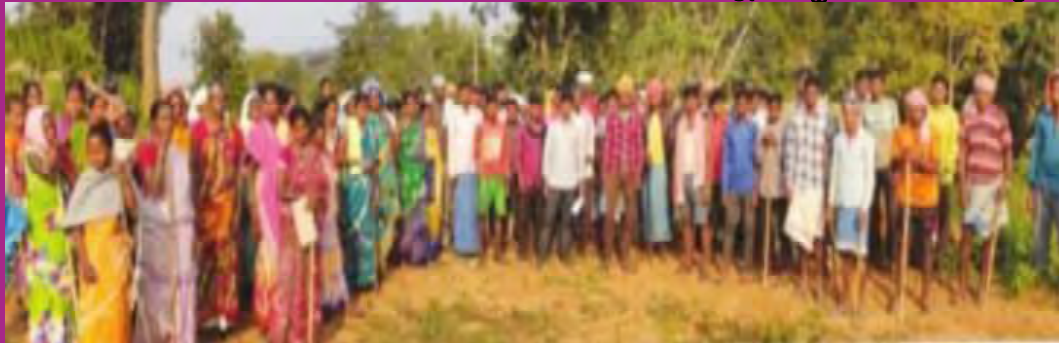
జర్నల్లో సీఆర్పీఎఫ్ క్యాంపుకు వ్యతిరేకంగా నిరసన తెలుపుతున్న గిరిజనులు