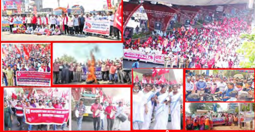
సార్వత్రిక సమ్మెను విజయవంతం చేసిన కార్మిక వర్గం

బీజేపీ మోడీ ప్రభుత్వం అధికారంలోకి వచ్చినప్పటి నుండి (ఏడేళ్ల పరిపాలనలో) నయా ఉదారవాద విధానాలను దూకుడుగా అమలు చేస్తూ ప్రజా వ్యతిరేక విధానాలకు పాల్పడుతున్నది. కార్పొరేట్లకు,