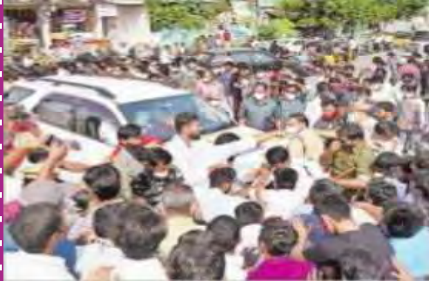
కలెక్టర్ వాహనాన్ని అడ్డుకుంటున్న విద్యార్థులు