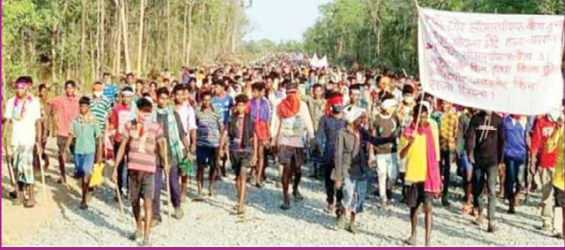
సీఎంపీఎఫ్ పోలీస్ క్యాంపుకు వ్యతిరేకంగా పోరాడుతున్న ఆదివాసీ ప్రజలు