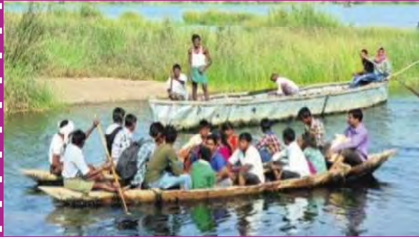
తుమ్మిడిహెట్టి వద్ద ప్రయాణం చేస్తున్న ప్రజలు