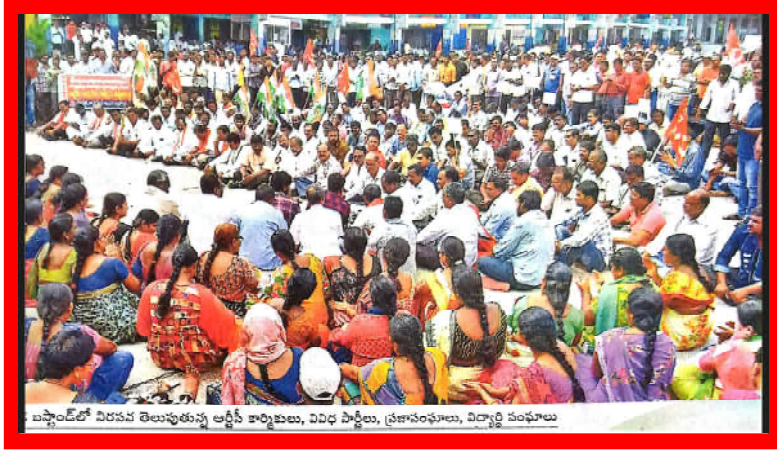
బస్టాండ్ లో విరమణ తెలుపుతున్న ఆర్టీసీ కార్మికులు, వివిధ పార్టీలు, ప్రజాసంఘాలు, విద్యార్థి సంఘాలు

తెలంగాణ రాష్ట్ర రోడ్డు రవాణా సంస్థలోని 49,190మంది ఉద్యోగులు ఆర్టీసీని ప్రభుత్వంలో విలీనం చేయాలనే ప్రధాన డిమాండ్ తో కలిపి 26 డిమాండ్లతో అక్టోబర్ నెల 4వ తేదీ అర్ధరాత్రి నుండి సమ్మెకు దిగారు. రవాణా