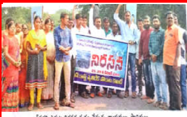
నేలగు ఎదుట నిరసన రచ్చం చేస్తున్న నాయకులు, స్థానికులు