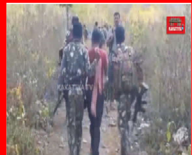
తాడ్వాయి అడవుల్లో పోలీసుల గాలింపు