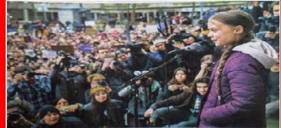
పర్యావరణాన్ని కాపాడాలంటూ ప్రసంగిస్తున్న గ్రేటా