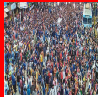
పౌరసత్వ చట్ట సవరణకు వ్యతిరేకంగా ర్యాలీ