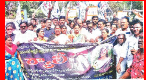
అత్యాచారాలకు వ్యతిరేకంగా ర్యాలీ