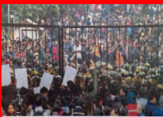
అమరావతి రాజధాని కోసం ర్యాలీ