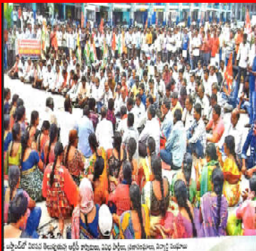
ఘాషా హాస్టల్ విషయ వివాదాన్ని ఖాళీ స్థానాలు, మొదటి స్థాయి, ప్రజాసభలు, విద్యార్థి సంఘాలు