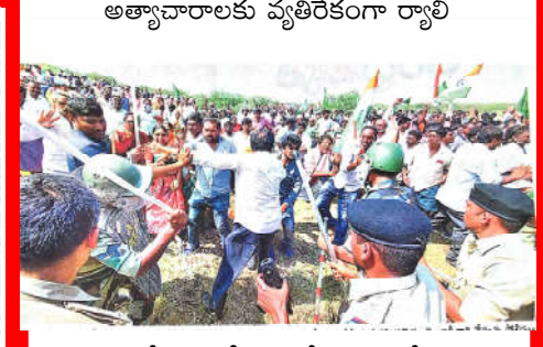
ర్యాలీపై లాఠీచార్జి చేస్తున్న పోలీసులు