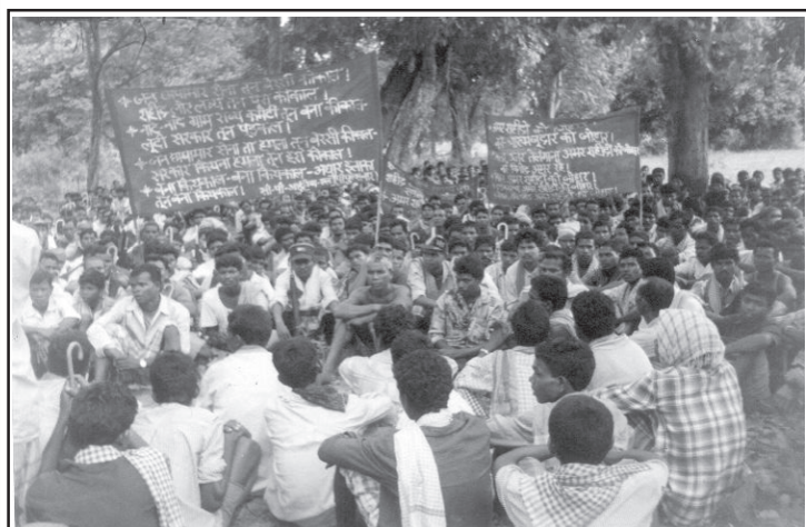
ప్రత్యేక ప్రజాస్వామిక బస్తర్ రాష్ట్రం సాధన విషయమై చర్చిస్తున్న ప్రజలు

గత 20 ఏళ్లకు పైగా మన ఛత్తీస్ గఢీలోని విశాల ప్రాంతంలో విప్లవ రైతాంగ ఉద్యమం కొనసాగుతున్నది. బస్తర్ నుండి సర్గాజ వరకు వేలాది మంది రైతాంగం సంఘటితమై ప్రజాయుద్ధాన్ని కొనసాగిస్తున్నారు. వారంతా బాటకపు పార్లమెంటరీ, ఆసెంబ్లీ ఎన్నికలను బహిష్కరిస్తున్నారు. గ్రామీణ ప్రాంతంలో కార్మిక-రైతాంగ మైత్రీ పునాదిపై ప్రజా రాజ్యాధికారాన్ని నెలకొల్పడానికీ సమరశీలంగా పోరాడుతున్నారు. విప్లవ ప్రజా సమితులను ఎన్నుకొని ప్రజలు బీజప్రాయంలో తమ అధికారాన్ని అనుభవిస్తున్నారు. ఇవి నిజమైన ప్రజాస్వామిక ప్రజా ప్రభుత్వ అంగాలు. వీటిని ఆదర్శంగా తీసుకొని సమస్త ఛత్తీస్ గఢీ ప్రజానీకం బాటకపు ఎన్నికలను బహిష్కరించి ప్రత్యమ్నాయ ప్రజా రాజ్యాధికార సంస్థలను నెలకొల్పుకోవాలని పిలుపునిస్తున్నాం. వీటికి ప్రజా గెరిల్లా సైన్యాన్ని అండగా నిలుపుకోండి. వేల సంఖ్యలో అందులో చేరిపోండి ! ☺