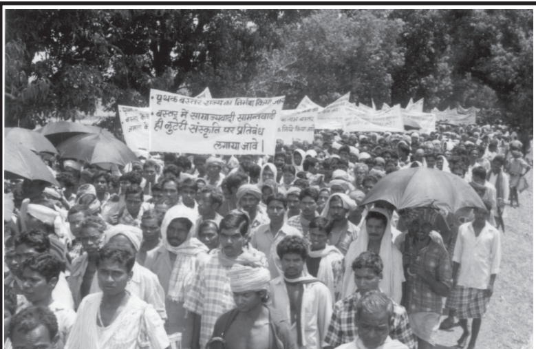
ప్రత్యేక ప్రజాస్వామిక బస్తర్ కోసం ఫిబ్రవరి 2001లో నారాయణపూర్లో ప్రజా ప్రదర్శన

ఈ వ్యవస్థలో ఒకసారి ఎన్నికల్లో గెలిపించిన తర్వాత వారు ప్రజల ప్రయోజనాలకు వ్యతిరేకంగా పని చేసినప్పటికీ వెనక్కి పిలిపించే హక్కు ఓట్లెసిన ప్రజలకు ఉండదు. ఇది బూటకపు ప్రజాస్వామ్యమనడానికి ఇంతకన్నా వేరే ఉదాహరణ అక్కర లేదు. అందుకే ఎన్నికలలో గెలిచిన ప్రతి వాడూ అవినీతి కుంభకోణాలకు పాల్పడడం, లంచగొండితనం, ప్రజలపై జాలం, దౌర్జన్యాలకు దిగడం, హత్యలు, లాటీలు, మాఫియా ముఠాలను నడపడం వంటివెన్నెన్నో చేస్తున్నాడు. ఒక్క మాటలో చెప్పాలంటే ఆరాచకత్వం రాజ్యమేలుతున్నది. ఉదాహరణకు ప్రస్తుత 13వ లోక్సభలో ఉన్న 542 సభ్యులలో 348 మందిపై క్రిమినల్ కేసులు నమోదై ఉన్నాయి. వీరిలో 171 మందిపై హత్య, దొంగతనాలు, మహిళలపై అత్యాచారాలు వంటి తీవ్రమైన ఆరోపణలు కూడా ఉన్నాయి. 71 మందిని వాళ్ల దుర్మార్గ చరిత్ర కారణంగా ఎలాంటి బ్యారంకు అప్పులకూ అనర్హులని ప్రభుత్వమే ప్రకటించింది. రావడం వీళ్ల స్వభావాన్ని