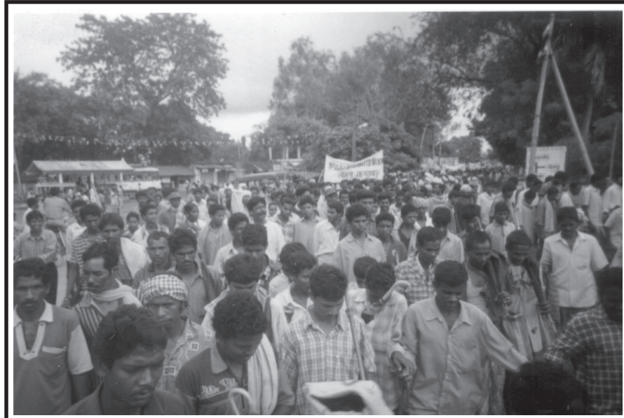
దుష్ట ధానేదారు అమృత్ కెర్కెట్టును శిక్షించాలని కోరుతో నారాయణపూర్‌లో ప్రజా ప్రదర్శన

నగర్పూర్ స్టీలు ప్లాంటు కోసం కరెంటూ, నీళ్లూ అందించడానికి గాను బోధ్‌పూట్ ప్రాజెక్టు నిర్మాణాన్ని తిరిగి ప్రారంభించాలని ప్రభుత్వం నిర్ణయించింది. బోధ్‌పూట్ ప్రాజెక్టు పూర్తయితే దాదాపు 50 గ్రామాలు ముంపుకు గురవుతాయి. వందలాది ఎకరాల అటవీభూములు నాశనమవుతాయి. ఈ ప్రాజెక్టు నిర్మాణానికి వ్యతిరేకంగా గతంలో మన పార్టీ నాయకత్వంలో ప్రజలు పోరాడారు. ప్రజా ప్రతిఘటనతో ప్రభుత్వం తన నిర్ణయాన్ని వెనక్కి తీసుకుంది. అయితే ఇప్పుడది నిర్బంధంగా పూర్తి చేయడానికి సిద్ధమైంది. ప్రజలకు జరిగే నష్టాల సంగతి దానికెందుకు?