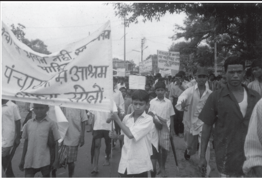
బస్తర్ బస్తర్ వాసులదే !

పలుకుబడి సంపాదించిన ఈ పార్టీ ఇప్పుడు పూర్తిగా అవకాశవాద పార్టీగా, కార్మిక వ్యతిరేక పార్టీగా పతనమైంది. పైకి తానొక ప్రజాస్వామ్య సంస్థనని చెప్పుకుంటూ, సామ్రాజ్యవాదాన్ని వ్యతిరేకిస్తున్నట్టు నటిస్తూ మరోవైపు ప్రభుత్వం అనుసరిస్తున్న కార్మికవ్యతిరేక విధానాలను పూర్తిగా మద్దతునిస్తున్నది. ఉదాహరణకు, దల్లి-రాజహారాలో గనుల యాజమాన్యం అమలు చేస్తున్న యాంత్రికరణను వేలాది మంది కార్మికులు వ్యతిరేకిస్తుండగా సిఎంఎం మాత్రం సమర్థిస్తున్నది. కాబట్టి ప్రజాస్వామ్య సంస్థలుగా చలామణి అవుతూ సారాంశంలో ప్రజల ప్రయోజనాలకు వ్యతిరేకంగా నిలిచిన ఈ దివాళాకోరు పార్టీలను ఎండగట్టాలి. బూటకపు ఎన్నికలకు బహిష్కరిస్తూ ప్రజాయుద్ధాన్ని తీవ్రం చేయాలి.