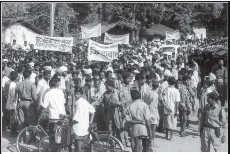
పోలీసుల తుపాకులను లెక్కచేయకుండా ప్రత్యేక బస్తర్ కోసం వెల్లువెత్తిన జనం

'సమాన పనికి సమాన వేతనం' కావాలంటూ ఆమరణ నిరాహార దీక్షకు పూనుకుంటున్న ఉపాధ్యాయులు, ఉమ్మడి మధ్యప్రదేశ్ ప్రభుత్వ కలం పోటుతో ఉద్యోగాలు కోల్పోయి నేటికీ దుర్బర జీవితాన్ని గడుపుతున్న దినసరి వేతన ఉద్యోగులు, సమస్యలతో సతమతమవుతున్న అన్ని శాఖల ప్రభుత్వోద్యోగులు, ఏటలా కరువు వాత పడుతూ పొట్ల గడుపుకోవడానికి పిల్లాపాపలతో వలస పోకతప్పని లక్షలాది కుటుంబాలు, ఆదివాసుల జనాభా ఎక్కువగా ఛత్తీస్ గఢ్ రాష్ట్రంలో అడవులపై ఎలాంటి హక్కు గానీ తాము సేకరించే అటవీ ఉత్పత్తులకు గిట్టుబాటు ధర గానీ