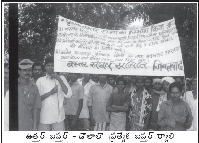
ఉత్తర్ బస్తర్ - డోలారో ప్రత్యేక బస్తర్ ర్యాలీ

మాడేండ్ల కింద మధ్యప్రదేశ్ రాష్ట్రాన్ని రెండుగా విడదీసి ప్రత్యేక ఛత్తీస్ గఢ్ రాష్ట్రాన్ని ఏర్పరచారు. నవంబర్ 1, 2000 నాడు నూతన ఛత్తీస్ గఢ్ రాష్ట్ర ప్రజానీకం గొప్పగా పండుగ జరుపుకున్నారు. మరోవైపు విశాల బస్తర్ ప్రజానీకం మాత్రం తమను బలవంతంగా ఛత్తీస్ గఢ్ రాష్ట్రంలో కలపకూడదని నిరసిస్తూ పెద్ద పెద్ద ర్యాలీలూ, ప్రదర్శనలూ జరిపారు. బస్తర్ ప్రజల న్యాయమైన డిమాండ్లను మా పార్టీ సమర్థిస్తూనే ఛత్తీస్ గఢ్ ప్రజల ఆకాంక్షలను ఎత్తిపట్టి ప్రత్యేక రాష్ట్రాన్ని ఆహ్వానించింది. అయితే నూతన రాష్ట్రం ఏర్పడినంత మాత్రాన ఎలాంటి కఠినమైన