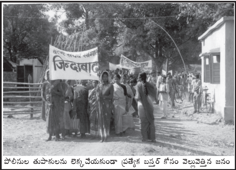
పోలీసుల తుపాకులను లెక్కచేయకుండా ప్రత్యేక బస్తర్ కోసం వెల్లువెత్తిన జనం

స్త్రీపురుషుల మధ్య నిజమైన సమానత్వాన్ని, రాజకీయ అధికారంలో పురుషులతో పాటు సమాన భాగస్వామ్యం, మహిళలను ఎట్టి పరిస్థితుల్లో రెండవ శ్రేణి పౌరులుగా చూడడానికి వీలు లేదని గట్టిగా నినదిస్తూ మహిళా విముక్తికై పోరాడుతున్న బస్తర్ ప్రాంత మహిళలపై పాలకవర్గాలు తీవ్రమైన అణచివేతను అమలుచేస్తున్నాయి. ఈ బూటకపు ఎన్నికల్లో మేం పాల్గొని ఓట్లెసేది లేదని అణచివేత చర్యలతో మమ్మల్ని పోరాటంలోకి రాకుండా అడ్డుకోలేరని నినదిస్తూ గత 22 ఏళ్లుగా ఎన్నికలు బహిష్కరిస్తున్నారు. నిర్బంధాన్ని సాయుధంగా ప్రతిఘటిస్తున్నారు. పోరాటాలను అణచివేయడానికి ఇక్కడ తిప్పవేసిన వేలాది మంది పోలీసులు ప్రజలను హింసిస్తున్నారు. ఇక్కడున్న రాష్ట్ర పోలీసులు సరిపోవడం లేదనీ, ముఖ్యంగా రానున్న ఎన్నికలను దృష్టిలో పెట్టుకొని మార్చి 2003లో రెండున్నర వేల మంది అర్ధసైనిక బలగాలను ఢిల్లీ నుండి