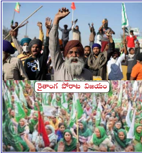
రైతాంగ పోరాట విజయం

సామ్రాజ్యవాద, బహుళజాతి కార్పొరేషన్ల, భారత దళారీ నిరంకుశ పెట్టుబడిదార్ల ప్రయోజనాలను నేరవేర్చడానికి కేంద్ర ప్రభుత్వం రూపొందించిన సాగు చట్టాల రద్దుకై యేడాది కాలంగా లక్షలాది రైతాంగం దిల్లీలో ధర్నా కొనసాగించి తుదకు విజయం సాధించారు. తమకు ఎదురు లేదని విగ్రహీగుతూ, పార్లమెంటులో తమకు గల మెజారిటీతో తాము ఏమైనా చేయగలమనే అహంతో అత్యంత నిరంకుశంగా 2020 సెప్టెంబర్లో రూపొందించిన మూడు సాగు చట్టాలను నవంబర్ 2021 చివరలో జరుగనున్న శీతాకాల సమావేశాలలో ఉపసంహరించుకుంటామనీ దేశ ప్రధాని నరేంద్ర మోదీ 19 నవంబర్ నాడు ఒక ప్రత్యేక ప్రకటన ద్వారా తెలియజేశాడు. ఇది భారత రైతుల పోరాట విజయం. యేడాదికాలంగా దిల్లీలో అనేక కష్టనష్టాలకు ఓర్చుకుంటూ తమ న్యాయవైస డిమాండ్ల సాధనకై ఉద్యమాన్ని కొనసాగించిన అన్నదాతలకు దేశం మొత్తం అండగా నిల్చింది. విదేశాలలోని అనేక మంది భారతీయులు, సంస్థలు భారత రైతాంగానికి తమ సంఘీభావాన్ని ప్రకటించాయి. ఆ రకంగా ఈ విజయం దేశ ప్రజలది. నిరంకుశ సాగుచట్టాల రద్దుకై యేడాది కాలంగా పోరాడుతూ దాదాపు 700కు పైగా రైతులు అసువులు బాసారు. వారందరికీ ముందుగా క్రాంతి వత్రిక విప్లవ జోహార్లర్చిస్తోంది.