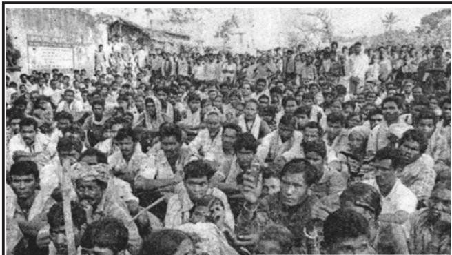
ఛసి మూలియా సంఘం, మహిళా సంఘాల నేతృత్వంలో మహాధర్మా