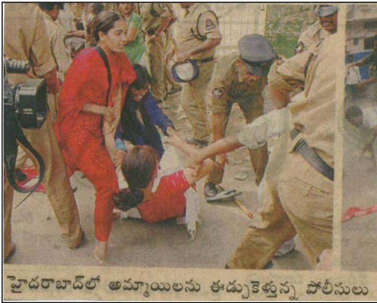
వైదరాబాద్లో అమ్మాయిలను ఈడ్చుకెళ్తున్న పోలీసులు

అన్ని వర్గాల్లో తీవ్ర వ్యతిరేకత వచ్చినందుకైనా ప్రభుత్వం ఈ సంఘటనపై క్షమాపణ చెప్పి ఉండాలి. కానీ ఫీజులు మరి ఎక్కువ ఏమీ పెంచలేదని, విద్యార్థులు కొంచెం ఆలోచించి ఉండవల్సిందని, పోలీసులు కూడా కొంచెం సహనం పాటించి