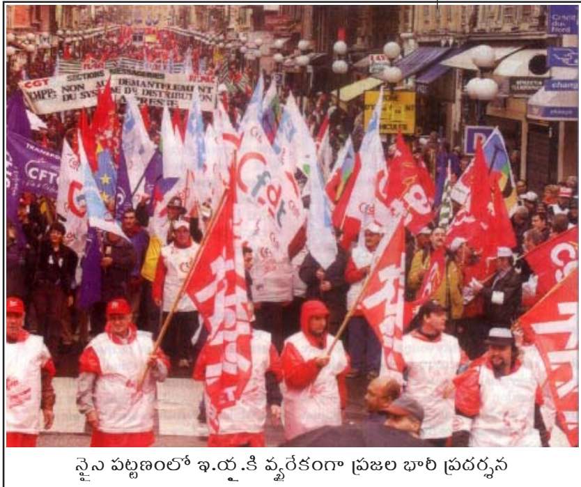
నైన పట్టణంలో ఇ.య.కి వ్యతిరేకంగా ప్రజల భారీ ప్రదర్శన

ఈ ప్రదర్శనకారుల్లో వివిధ దృక్పథాలు కలిగిన అసమ్మతివాదులున్నారు. ప్రపంచీకరణ (తరువాయి 32వ పేజీలో...)