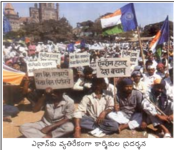
ఎన్డ్రాన్ కు వ్యతిరేకంగా కార్మికుల ప్రదర్శన

ద్రోహులైన ప్రస్తుత, గత మహారాష్ట్ర పాలకులు రాష్ట్ర ప్రజల ప్రయోజనాలను అమెరికన్ బహుళజాతి సంస్థ ఎన్డ్రాన్ కు తెగనమ్మేశారు. యూనిట్ కు 6 రూ॥ 80 పైసల చొప్పున మహారాష్ట్ర విద్యుత్ బోర్డు ఎన్డ్రాన్ కి చెల్లిస్తూంది (దోచి పెడ్తోంది). మహారాష్ట్ర విద్యుత్ బోర్డు తాను స్వయంగా ఉత్పత్తి చేస్తున్న విద్యుత్ కు యూనిట్ వారి ఖర్చు 1 రూ॥ 30 పైసలు కాగా, అలాగే ఇతర మార్గాలలో (అంటే కేంద్రం, ఇతర రాష్ట్రాల నుండి) కొంటున్న విద్యుత్ కు సగటున 2 రూ॥ 30 పైసలకు కొంటుంది. కానీ, మహారాష్ట్ర విద్యుచ్ఛక్తి బోర్డు ఎన్డ్రాన్ కు మాత్రం యూనిట్ కు 300 శాతం అధికంగా ధర చెల్లిస్తుంది. ఒకప్పుడు అత్యధిక లాభాల్లో ఉన్న మహారాష్ట్ర విద్యుచ్ఛక్తి బోర్డును దివాలా స్థితిలోకి ఈ ఒప్పందం నెట్టేసింది. మే 2000 చివరి నాటికి 2వేల కోట్ల రూపాయల లోటు తేలింది.