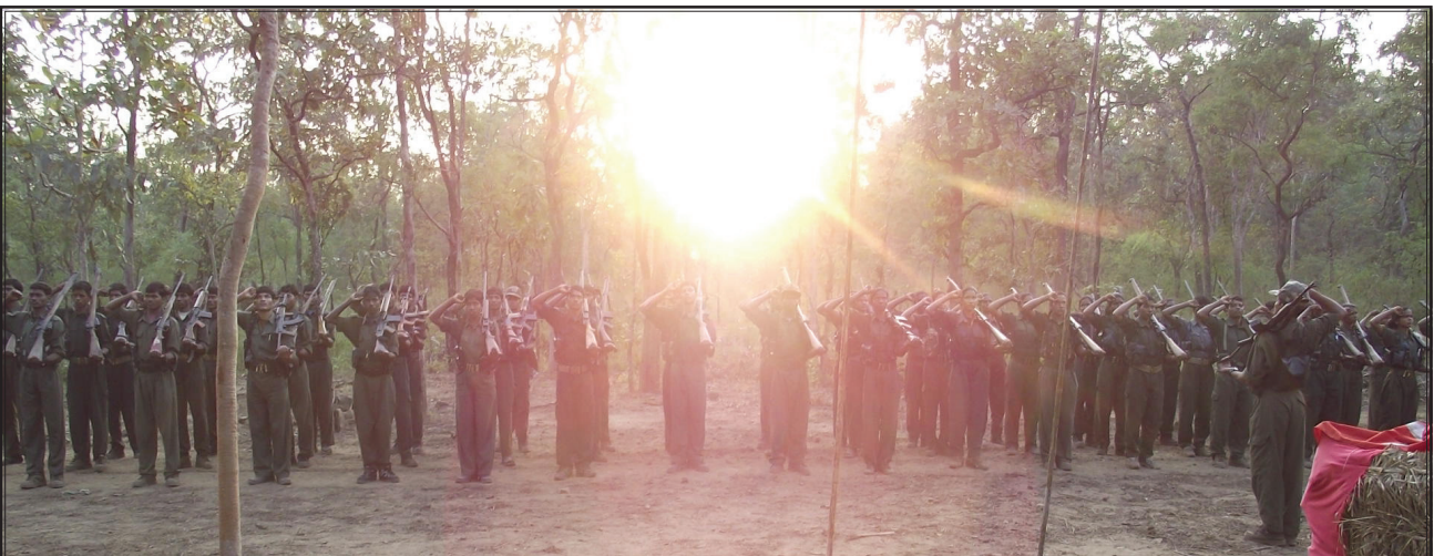
ప్రజా విముక్తి గెరిల్లా సైన్యం పదేళ్ల ఉత్సవాలు