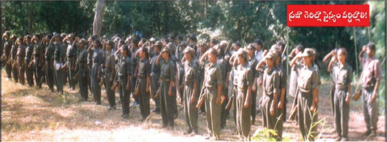
ప్రజా విముక్తి గెరిల్లా సైన్యం ఆవిర్భావ పెరేడ్

“సాధించిన విజయాలతో తృప్తి పడకూడదు. శత్రువును తక్కువగా అంచనా వేయకూడదు. దాడుల తీవ్రత తగ్గించడం గానీ, ముందుకు వెళ్లడానికి తటపటాయింపు గానీ ప్రధానమవుతుంది. తద్వారా శత్రు నిర్మూలనకున్న అవకాశాన్ని పోగొట్టుకొనకూడదు. లేదంటే విప్లవానికి ఓటమి తప్పదు.”