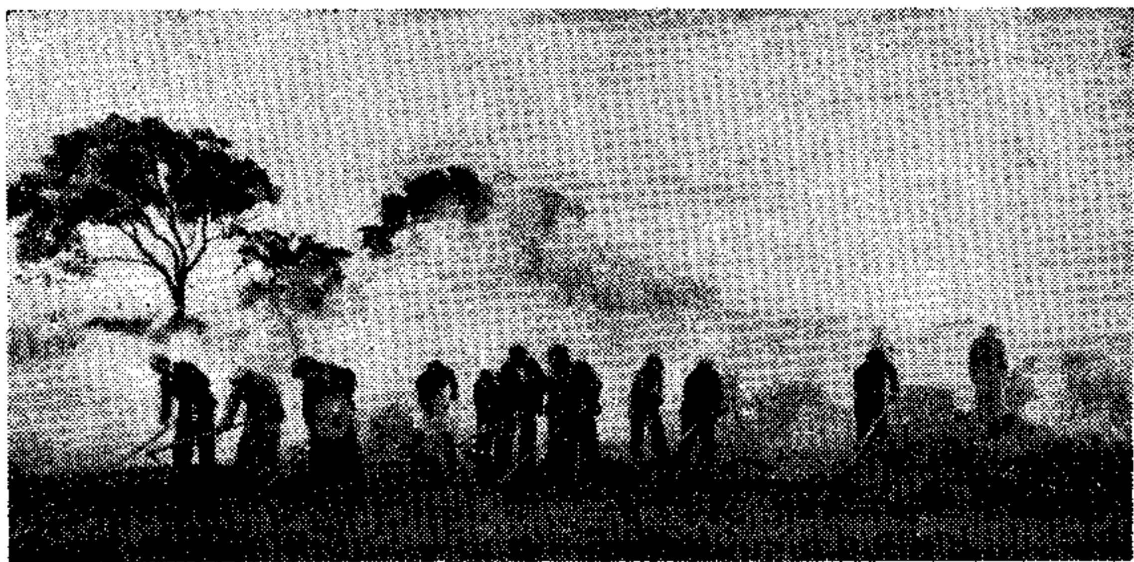
煤烟漫卷送瘟神(人們把荒地上的杂草連根鏟除后,用燒和埋的方法消灭釘螺)