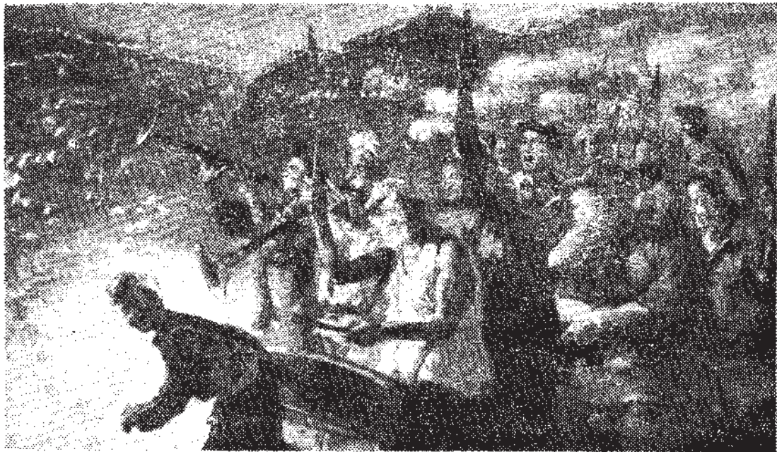
欢呼抗日战争胜利（一九四五年在延安）

岸信介政府这样坚持追随美国侵略政策和敌視中国的政策，是把日本推向絕路，結果它一定要慘遭失敗。既然日本紧紧地被拴在美国的战車上，这将使它在曾經飽受日本侵略的亚洲国家中日形孤立；而日本經濟上对美国的依賴，也更难以摆脱。日本对美国的貿易每年都有大量逆差。日本的工矿生产量已达到战前的二倍多，但出口額还没有超过战前的水平。生产与市場的基本矛盾始終不能解决，反而由于帝国主义国家間的竞争尖锐化而日益严重。岸信介今年亲自到欧洲作“高級推銷員”，也沒有多大的收获。日本的經濟愈来愈不稳定，现在还存在着六百万